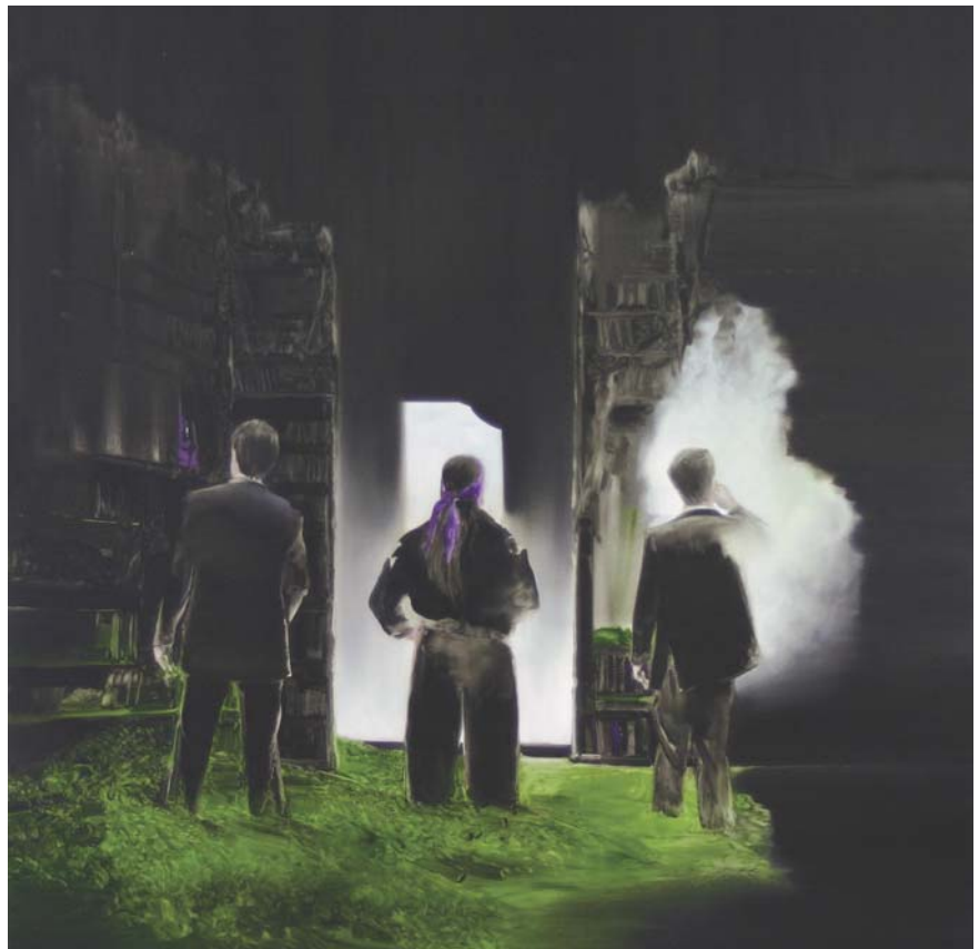
Sturm, Öl auf Leinwand, 190 x 180, 2008

Gottfried Benns Worte aus seiner Schrift „Lebensweg eines Intellektualisten“ könnten den hier versammelten Gemälden als Untertitel hinzugefügt werden, findet doch das Wesen der Malerei Igor Oleinikovs durch diese Formulierung seinen treffendsten Ausdruck. Zunächst sind es die gattungsspezifischen Eigenheiten, die in der Kunst Oleinikovs besonders hervor-