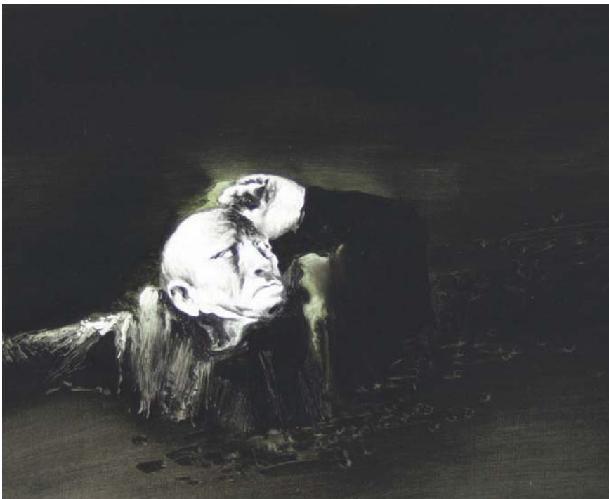
Seeman, Öl, Bleistift auf Papier, 50 x 65, 2008

treten: Malerei an sich ist paradox, denn sie bewirkt das, was sie nicht ist. Formal betrachtet ist ein Bild statisch, bewegungslos, ein durch seine Maße beschränktes, nach seiner Vollendung sich nicht mehr veränderndes Stück bemalte Leinwand. Dem gegenüber steht die Wirkung, welche Malerei auf uns auszuüben vermag. Finden wir den Zugang, entwickelt das Bild vor unserem geistigen Auge ein bewegtes Eigenleben, es eröffnen sich uns unergründliche Weiten, und stets aufs Neue erscheint uns das Bild beim Betrachten vertraut und doch unbekannt zugleich.“