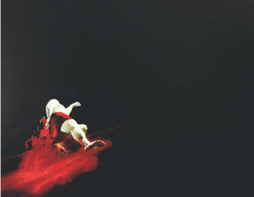
Streuer, Öl auf Leinwand, 190 x 220, 2008

mer das Berliner Atelier des 1968 im russischen Krasnodar geborenen Malers Igor Oleinikov betritt, wird unwillkürlich von der herausfordernden Melancholie der hier versammelten großformatigen Gemälde in Bann gezogen. Weit entfernt von jeder modischen Attitüde, begegnet man in den asphalttonigen Bildern Oleinikovs einer male- risch ausgereiften Sublimation von Selbstanalyse und Realitätserfah- rung. Jedes Sujet verweigert eine di- rekt ablesbare Bildanekdote. Der Prozess des Malens erweist sich viel- mehr als ein existenzielles Gesche- hen, in dessen Verlauf der Künstler seine Emotionen verortet und sich selbst reflektierend zu umgreifen versucht.“