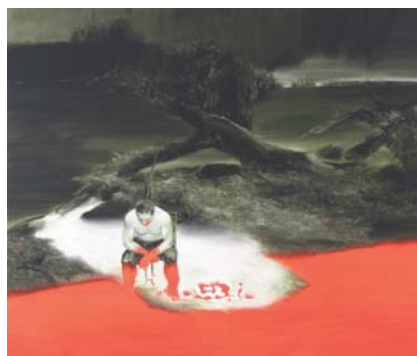
Für die Kunst, Öl auf Leinwand, 190 x 220, 2007

Mit den post-avantgardistischen Strömungen ist heute eine neue sprühende Sinnlichkeit in die Kunst zurückgekehrt. Die Renais-