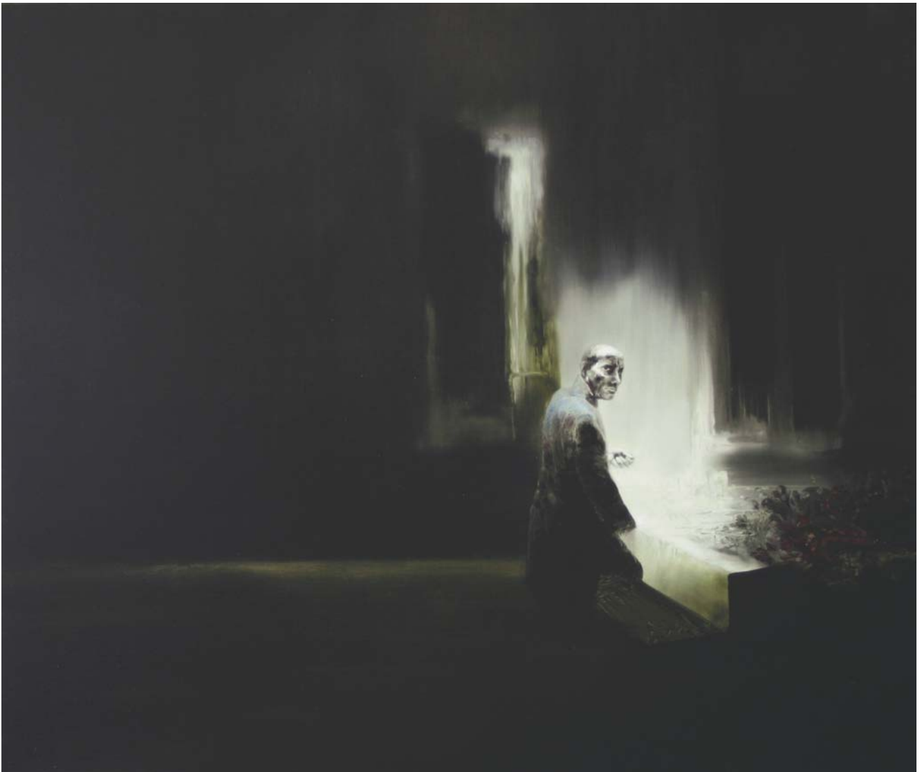
Fest, Öl auf Leinwand, 150 x 170, 2008

begnadete Schaffenskraft, die es ihm ermöglicht, neue nie dagewesene Zeichen in der Malerei zu setzen. Seine frei inszenierten Bilder von höchster formaler wie farblicher Raffinesse lassen den Betrachter aufhorchen und versetzen uns in Staunen, zeitgenössische Kunst in dieser außergewöhnlichen Qualität erleben zu dürfen.