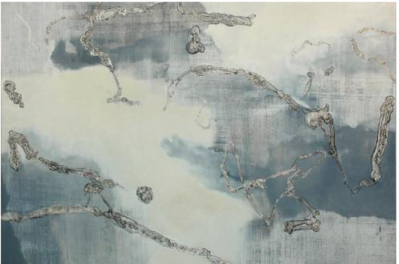
Selbstbildnis denHimmel betrachtend, 190 x 280 cm, 2006

Problematischer als die Lokalisierbarkeit konkreter Einflüsse auf den Körper ist die Definierbarkeit mentaler Prozesse, welche abstrakte