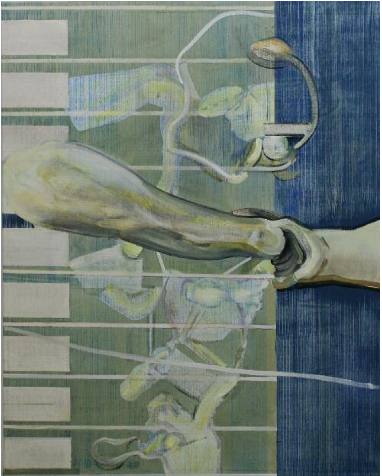
Zeitplan 1, 146 x 114 cm, 2007