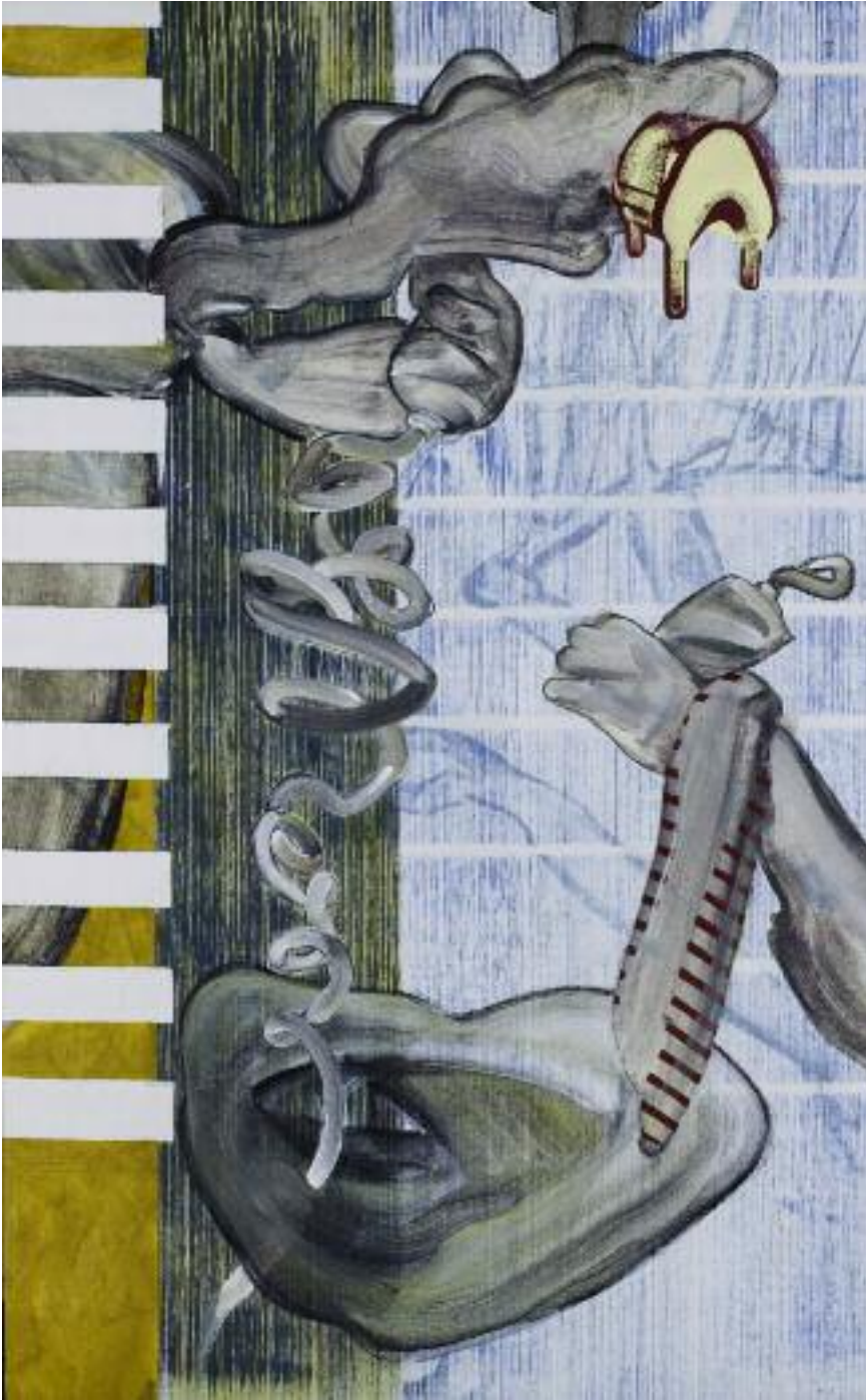
Geduld, 123 x 76 cm, 2008

Um in Beziehung zu dieser Metakognitiven Malerei zu treten, muss der Betrachter den kompositorischen Vorschlag zu einer inneren Gegebenheit mit seinen eigenen Erfahrungen