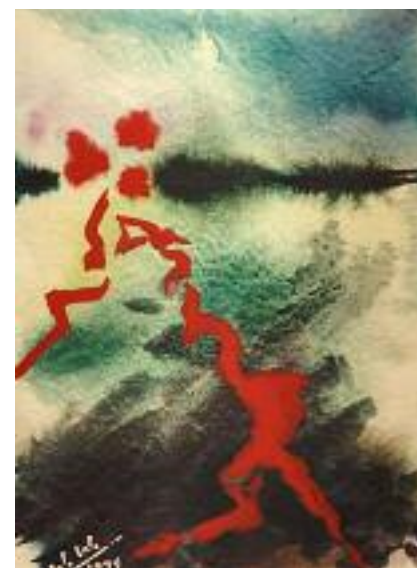
Der Drache - Der Vogel + Der Tod, 1999