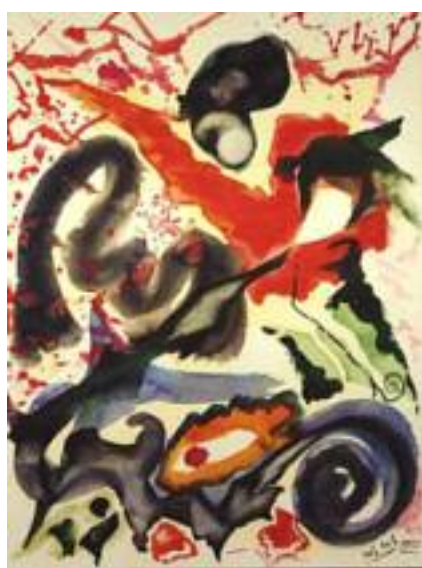
Komposition, Aquarell, 48 × 56 cm, 1995