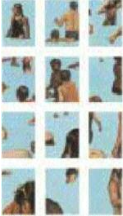
Ornament von Benjamin Nachtwey, Öl auf Hartfaser, 12 Tafeln a 18 × 25 cm