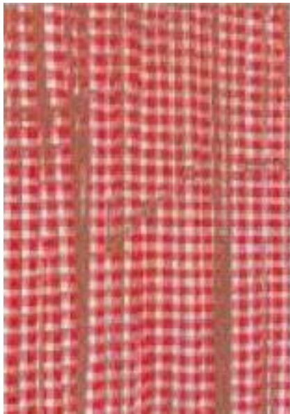
Vorhang von Anke Berßelis, Öl auf Nessel, 95 × 130 cm