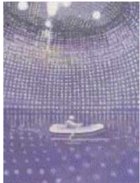
O.T. von Etsuko Watanabe, Öl auf Holz, 35 × 45 cm

Vor dem Hintergrund derartig lebensbejahender künstlerischer Aussagen wird die Thematik „Überlebenschancen“ eindringlich unterstützt und geprägt, wird die Seele als Quelle unserer Gefühle nachhaltig berührt.