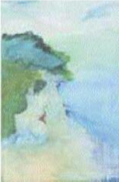
Küste von Benjamin Bohnsack, Tempera auf Leinwand, 70 × 110 cm

Viele Ärzte kämpfen täglich mit aller Kraft um das Überleben ihrer lebensgefährlich erkrankten Patienten – schreibt Jürgen Bufler, Produktionsleiter für Antiinfektiva des Arzneimittelherstellers Pfizer – und können oft nur hilflos zusehen, wie sie den Patienten trotz aller Bemühungen verlieren.