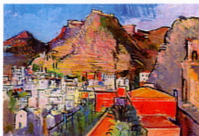
Anton Faistauer (1887–1930) Taormina mit Blick auf Mola, 1929