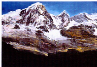
Herbert Brandl (geb. 1959) Ohne Titel, 2001